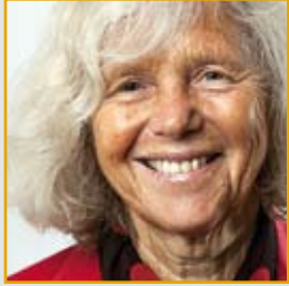
Verena Kast 71