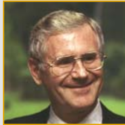
Gottfried Schatz 77