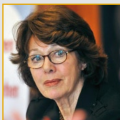
Dr. Marianne Koch 82