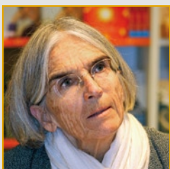
Donna Leon 71